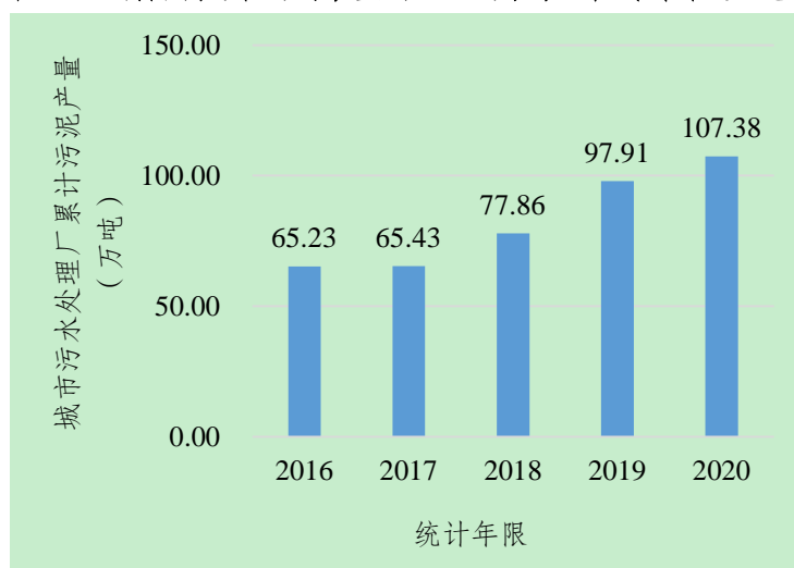
图3 “十三五”期间城市污水处理厂污泥产量（单位：吨/万吨）

“十三五”期间，我市全面提升污泥处理处置能力，加快城镇生活污水污泥处理处置设施建设。全市新、扩建 38 座污泥处理处置设施，新增处置能力 4947 吨/天，位于西南地区首位。其中，新建设施 36 座，新增处置能力 4587 吨/天；扩建设施 2 座，新增处置能力 360 吨/天。截至 2020 年底，全市共建有污泥处理处置设施 42 座，总处理处置能力 5837 吨/天。通过设施建设，基本实现污泥处理处置设施全覆盖。至“十三五”期末，除武隆区、石柱县、城口县外（污泥运至周边区县进行无害化处理处置），各区县均保有至少一座污泥处置点。