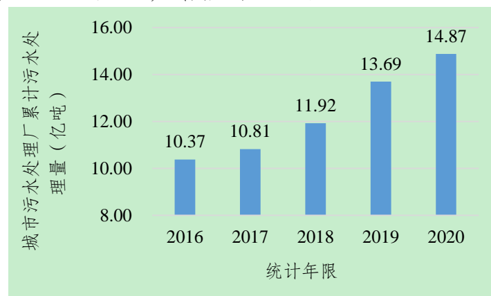
图 1 “十三五”期间城市污水处理厂污水处理量（单位：亿吨）

“十三五”期间，我市积极推进城市污水处理厂能力建设，污水处理量由 2016 年 10.37 亿吨增加至 2020 年 14.87 亿吨，增幅约 43%。积极推进城市污水处理厂提标改造，出水水质由一级 B 标提升至一级 A 标，湿污泥产率由 2016 年 6.29 吨/万吨（含水率以 80%计）增加至 2020 年 7.22 吨/万吨，增幅约 15%。“量”与“质”的双重提升使得我市城市污水处理厂污泥产量增加，由 2016 年 65.23 万吨（含水率以 80%计，下同）增加至 2020 年 107.38 万吨，增幅约 65%。