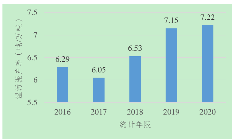
图2 “十三五”期间城市污水处理厂湿污泥产率（单位：吨/万吨）